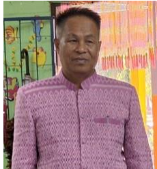
รูปภาพ ผู้อำนวยการโรงเรียน